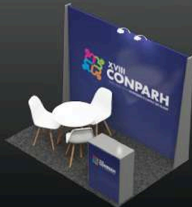
STAND 2x3 A