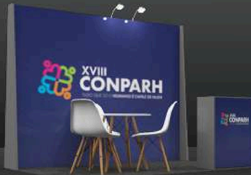
STAND 2x3 A