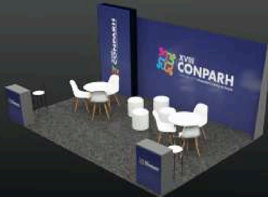
STAND 6x4 A