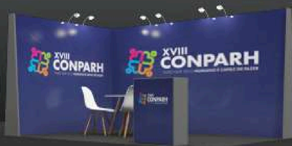
STAND 4x3 A